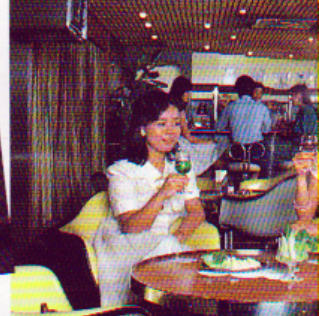
身も心も解きほぐす、パブ