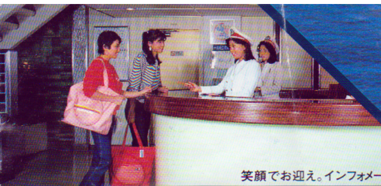
笑顔でお迎え。インフォメーション。

旅のロマンを満載して白いカー・フェリーは毎日、太平洋を航行しています。数々の娯楽施設やレストラン、パブ・バーなど楽しい船内と、様々な表情を見せる船からの眺め。まさに豪華1万トンフェリーならではの旅の世界です。