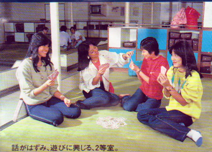
話がはずみ、遊びに興じる、2等室。

旅のロマンを満載して白いカー・フェリーは毎日、太平洋を航行しています。数々の娯楽施設やレストラン、パブ・バーなど楽しい船内と、様々な表情を見せる船からの眺め。まさに豪華1万トンフェリーならではの旅の世界です。