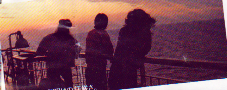
感動的な夜明けの荘厳さ。