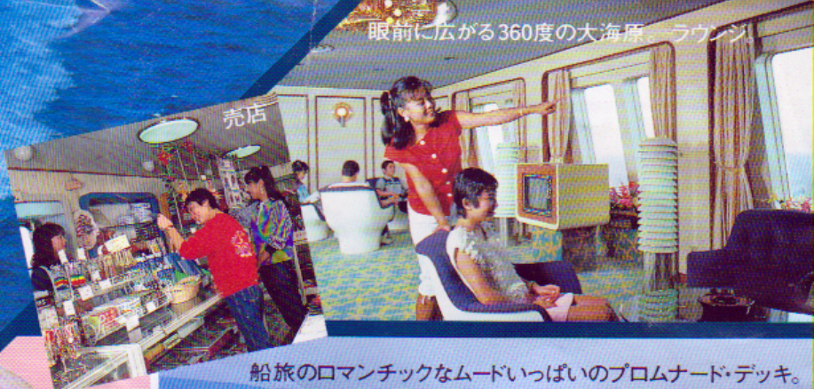
船旅のロマンチックなムードいっぱいのプロムナード・デッキ。