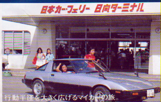
日本カーフェリー 日向号・ミナル