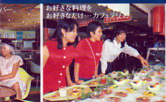
好きな料理を好きなだけ...カフェテリア