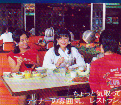
ちょっと気取ってディナーの雰囲気。レストラン。