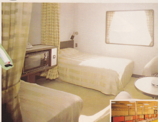
特等/満室で快適な船室。豊かなつろぎに つつまれて、ごゆっくりおやすみください。