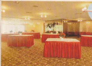
あなたらしいアイデアと演出で、ご活用ください。