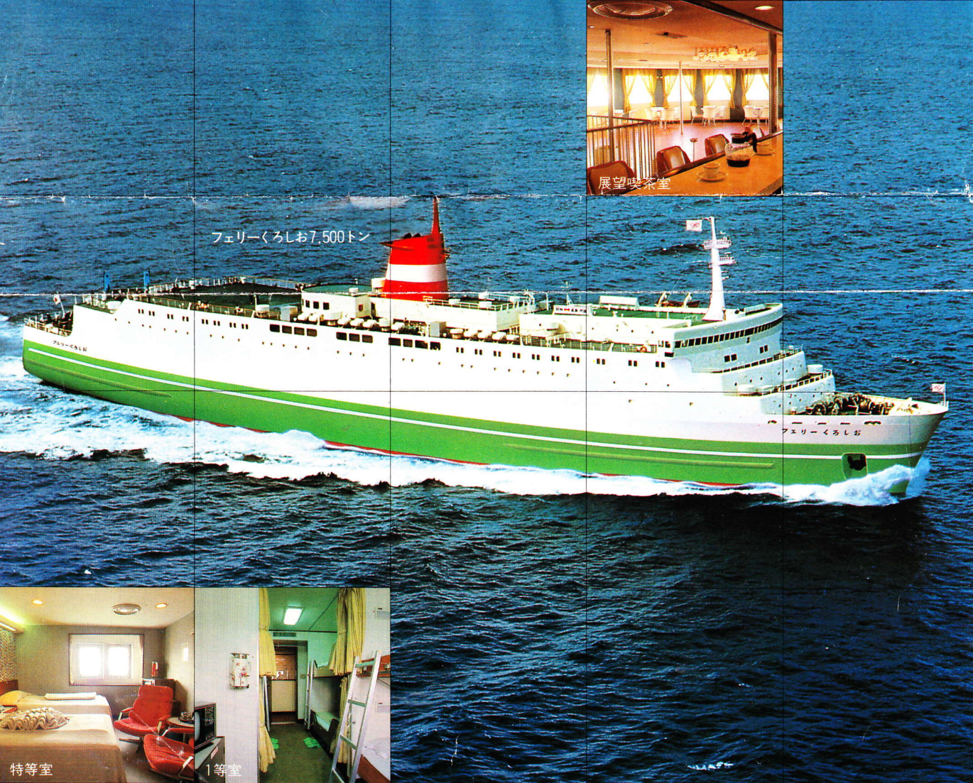
フェリーくろしお7,500トン