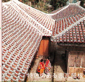
特色のある赤瓦屋根