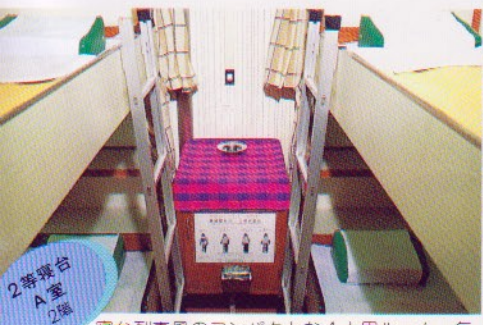
2等樓台 A室 2階