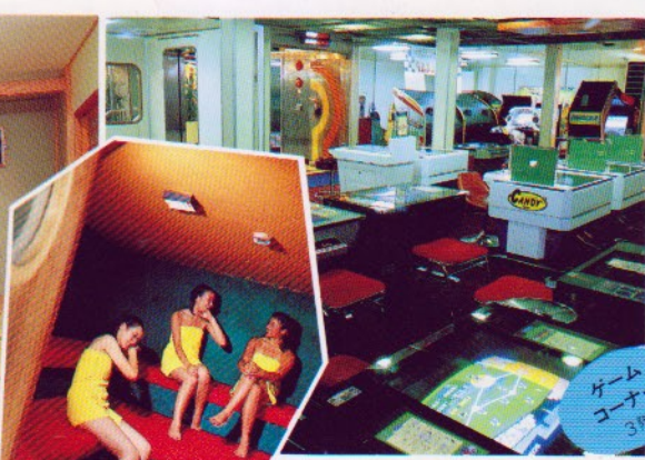
ゲーム コーナー 3階

本格的な純日本間。喧嘩から離れてしっとり と落ち着けることでしょ。バス・トイレ付 のお2人部屋。