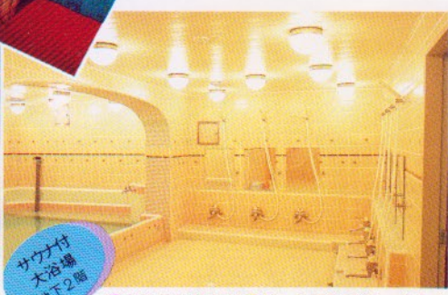
サナ付 大浴場 地下2階