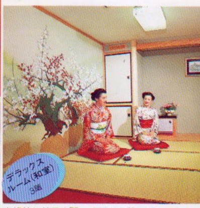
デラックス ルーム(和室) 3階

スカイグラスを通してながめる 星空のページェント。パー ティーなどにご利用いただ きたいホール。